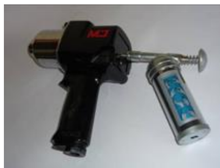
Mazání utahovacího mechanismu